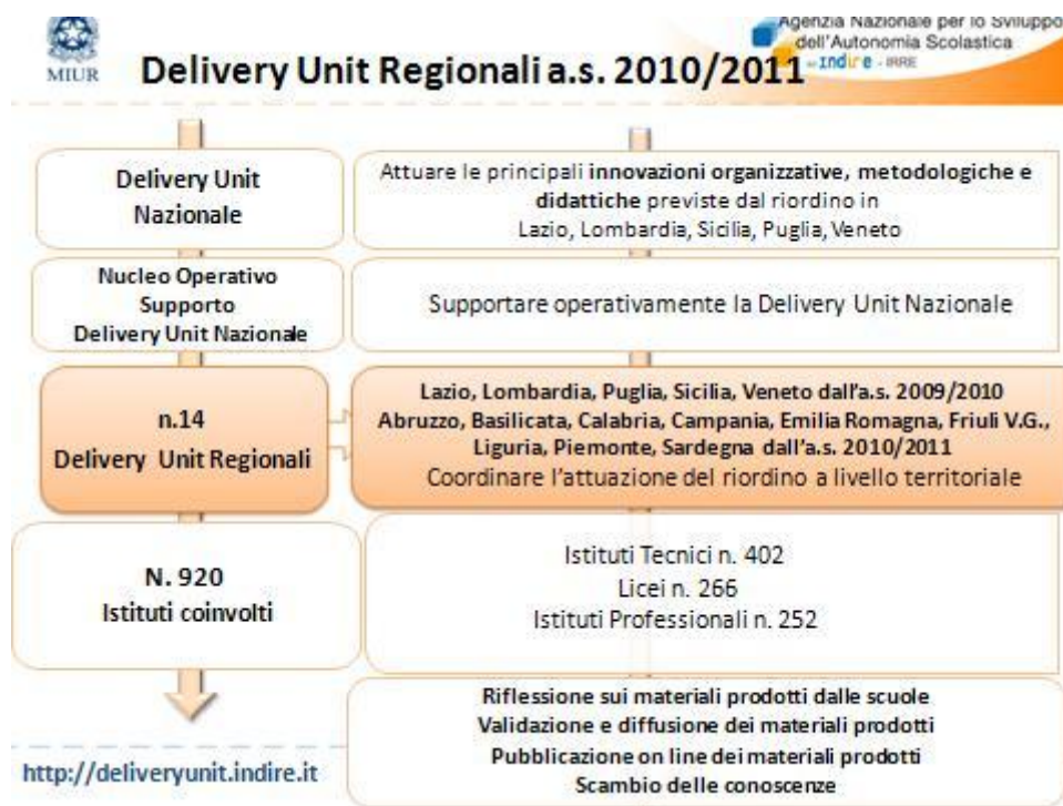
Fig.1 Processo di attuazione delle Delivery Unit

Le Delivery Unit nate per supportare il riordino degli istituti tecnici si sono ampliate anche ad altri ordini scolastici: su 920 istituti Delivery impegnate nell'azione di "ricerca e sviluppo", ben 266 sono Licei e 252 Istituti Professionali.